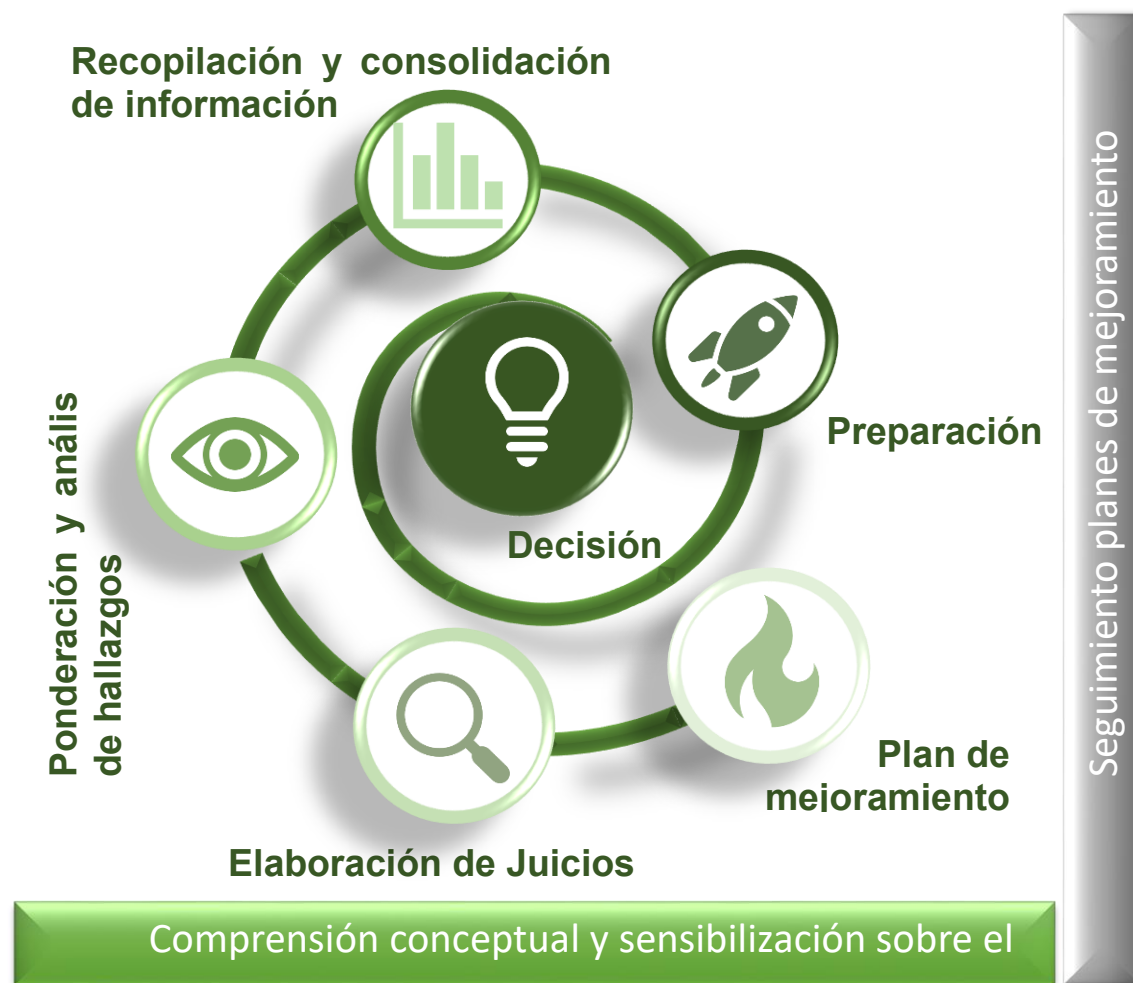
Figura 2. Fases metodológicas de la Autoevaluación